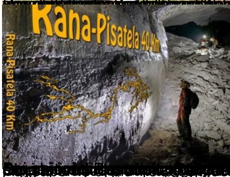
Le grotte sono ancora molto utilizzate per il turismo speleologico. Grotte di Kana-Pisatela