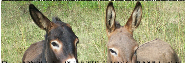
Le mulattiere sono ancora molto utilizzate per il trasporto di turisti e bagagli in montagna.